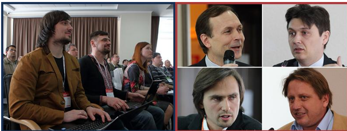
На ACAIP-2015 звучали уникальные и содержательные доклады от ведущих экспертов отрасли высоких технологий

Стоит обратить внимание, что Международный Форум ACAIP-2015 в Киеве является единственным специализированным мероприятием такого рода, поддерживаемым ИТУ в 2015 году. Международный союз электросвязи неоднократно становился партнером форумов и конференций CIS Events Group в Украине, за что организаторы выражают искреннюю благодарность.