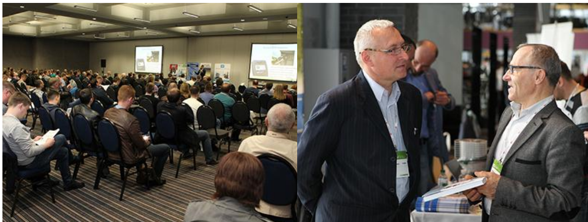
Міжнародний Гранд Форум АСАІР-2017 в Києві зібрав 436 учасників

На Форумі прозвучало багато цікавих виступів галузевих експертів. Крім цього учасники Форуму змогли відвідати виставку, взяти участь в дискусіях, а також поспілкуватися з партнерами в формальній і неформальній обстановці.